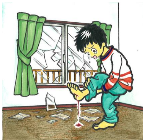
地震・台風でガラス飛散