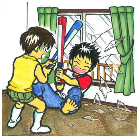
子どもや高齢者の衝突