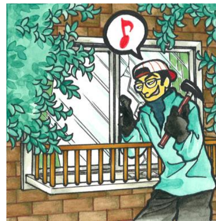
ガラス破りの防犯